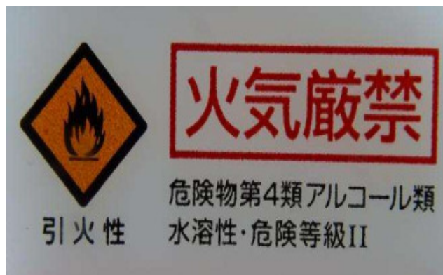
【危険物に該当する場合の表示例】

今般の新型コロナウイルス感染症の発生に伴い、消毒用アルコールを使用する機会が増えています。アルコール濃度が一定以上の消毒用アルコールは、消防法上の危険物に該当し、当該消毒用アルコールから発生する可燃性蒸気は引火しやすく、また、空気より重く低所に滞留しやすいため、貯蔵・取扱いを行う際は注意が必要です。